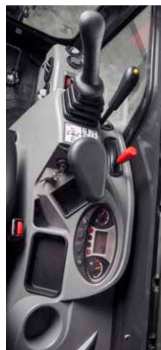
Tableau de bord

Nouveau tableau de bord pour contrôler d'un simple coup d'œil tous les paramètres (arrêt automatique du moteur, arrêt automatique des feux de travail, alarme sonore en cas de défaillance).